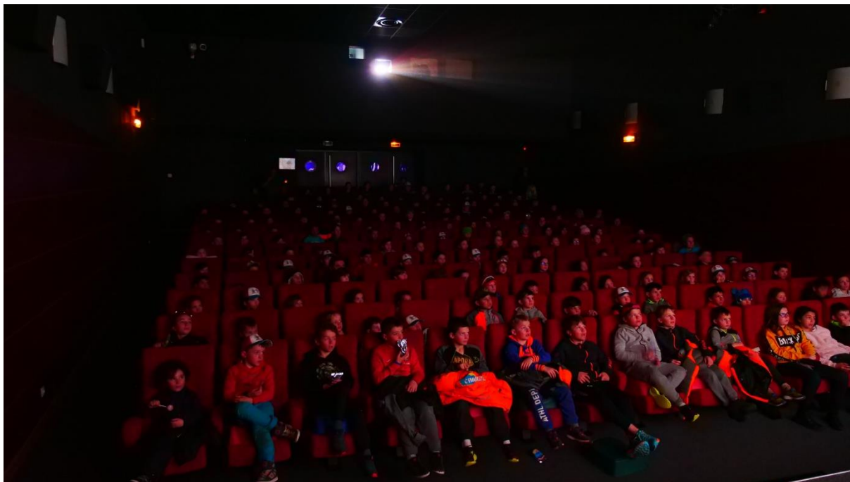
Lors de la séance de cinéma, les enfants ont pu découvrir « Terra Willy », le dernier film d'animation de Disney

La journée du samedi a proposé plusieurs animations aux enfants. Goûter et séance de cinéma ont clôturé cette journée de manière détendue, avant de se lancer dans la compétition.