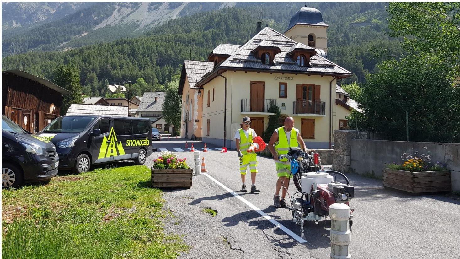
L'ensemble de la signalétique au sol des Alberts a également été repeinte