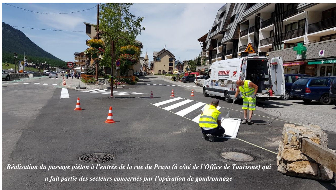
Réalisation du passage piéton à l'entrée de la rue du Praya (à côté de l'Office de Tourisme) qui a fait partie des secteurs concernés par l'opération de goudronnage

C'est ainsi que la société Proximark intervient, sur la station, ainsi qu'aux Alberts, depuis le lundi 24 juin pour repeindre l'ensemble des passages piétons, bandes cyclades, stops, cédés le passage et autres marquages routiers effacés par la neige de la saison hivernale ou qui ont dû être repris à la suite de l'importante opération de goudronnage réalisée début juin.