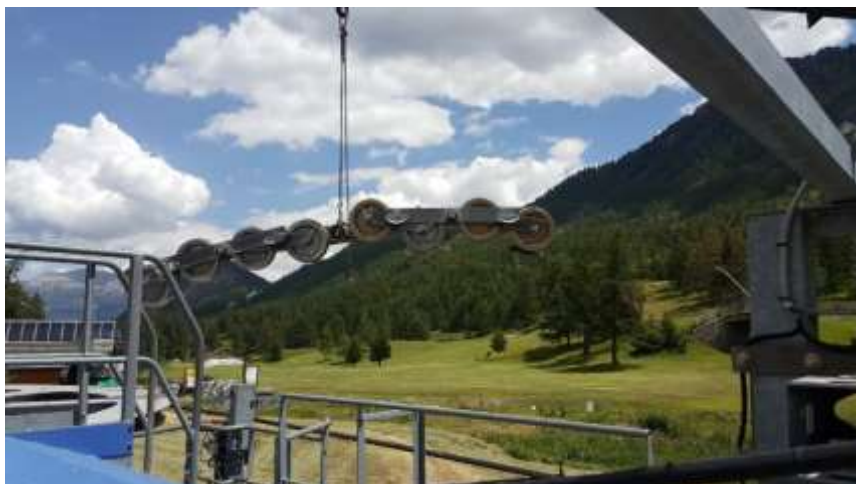
Dépose des balanciers au TS Tremplin

La Régie a la particularité d'effectuer l'ensemble des ces missions en interne grâce à la compétence de ses équipes.