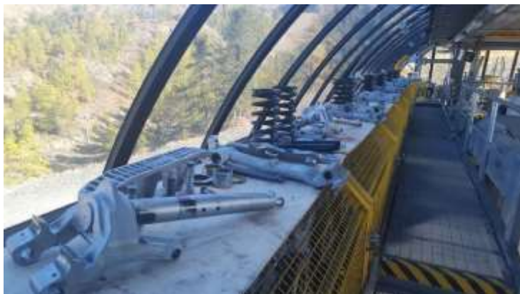
Grande visite des pinces aux Chalmettes (24 véhicules)