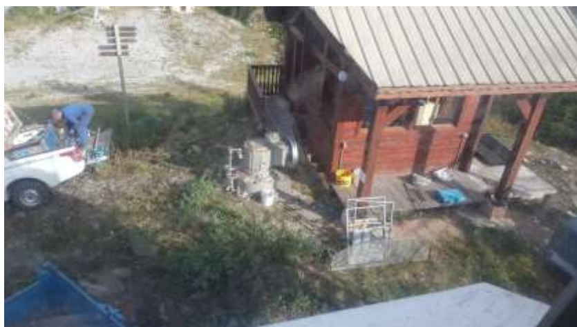
Dépose et changement du roulement TS Tremplin