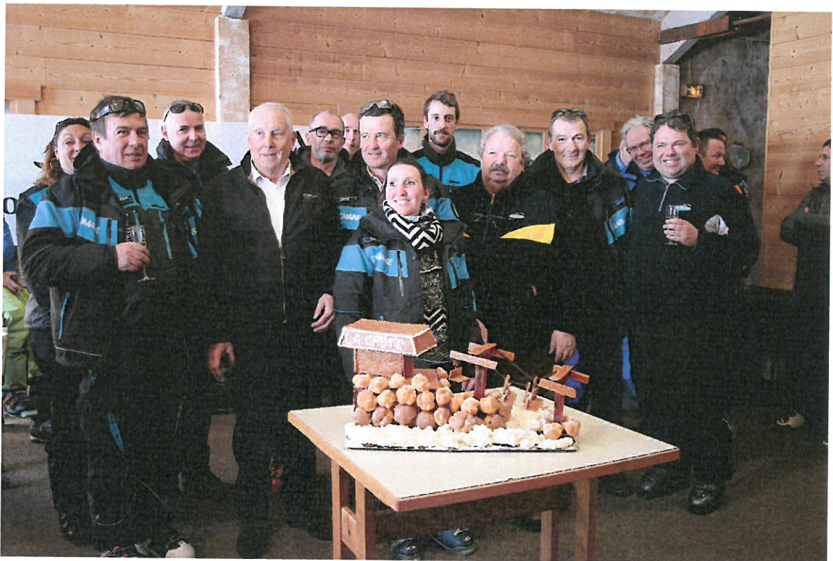
L'équipe de la Régie Autonome des Remontées Mécaniques, avec les représentants des entreprises ayant participé à la construction du télésiège de la Crête.

Après avoir procédé au coupage du ruban, tout le monde s'est retrouvé pour un buffet convivial au restaurant altitude « Les Anges ».