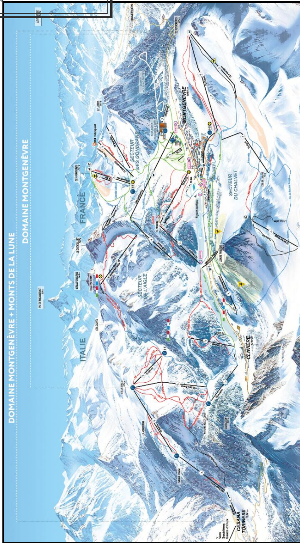
Plan des pistes du domaine skiable de Montgenèvre / Monts de la Lune

Mentionnons que l'application mobile Montgenèvre, et le site skipass.montgenevre.com , permet de disposer en temps réel des informations sur les remontées mécaniques ouvertes, les pistes accessibles, l'état des liaisons avec le domaine italien et les quantités de neige.